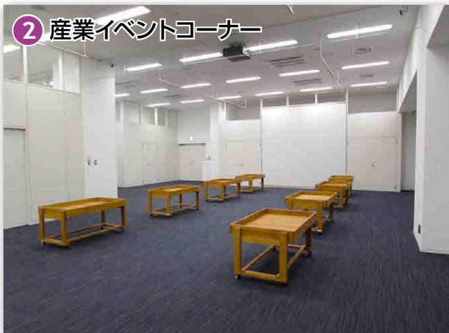
② 産業イベントコーナー