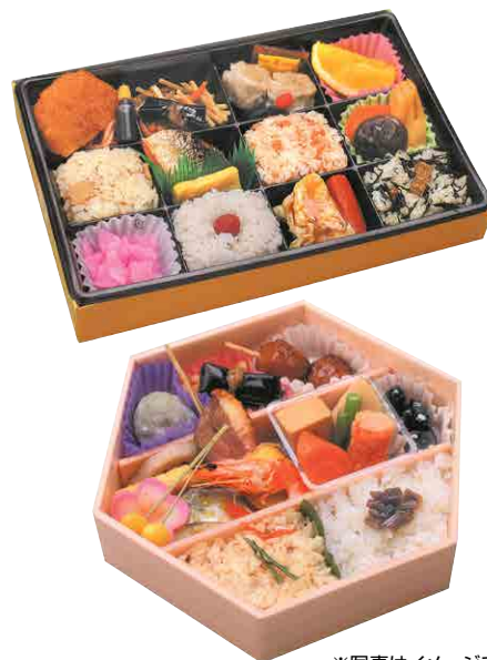
※写真はイメージです。

★ 優待・サービス ★ 区民・産業プラザご利用の方は10%割引にて提供させていただきます。