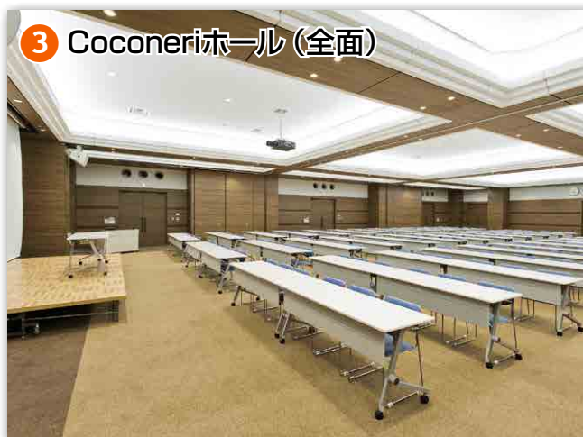
③ Coconeriホール (全面)