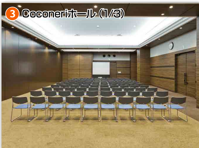
③ Coconeriホール (1/3)