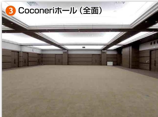
③ Coconeriホール (全面)