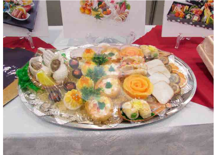
(令和元年ケータリングイベントの様子) ※令和2年・3年はコロナウイルスのため中止